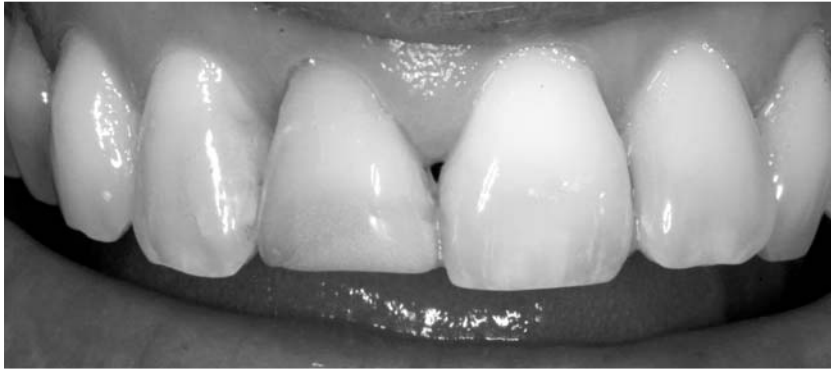
10:00 h. Paciente que presenta una lesión irreversible en la raíz del incisivo central derecho.

Además se consigue un MEJOR RESULTADO final, al reducir el trauma que supone para la cicatrización una cirugía más extensa.